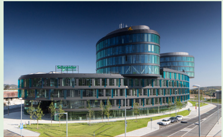
Waltrovka – Aviatca, Prague 5 • Facility management: Rilancio

“We offer our clients energy audits and energy assessments to optimise energy consumption, including process analyses and the configuration of existing technologies ,” Ryvola explained. With years of experience in the field of technical management, Rilancio is one of the leading experts in this field and therefore offers its clients a professional solution with a sensitive approach to technologies while taking into account a possible extension of their useful life. One advantage of the offered solution is the management summary, i.e., a summary of information about the proposed measures, their rate of return and the possibility of using grant programs. “We are aware of the importance of this issue and therefore our energy specialists offer immediate assistance to clients with the identification and follow-up of measures,” Ryvola added.