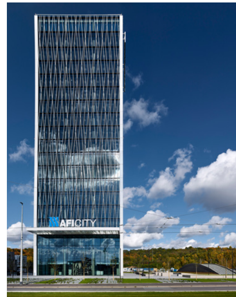
AFI City 1, Praha 9 ■ Facility management: Rilancio

Solutions s unikátní patentovanou technologií NPBI , které zachytí všechny typy znečištění (včetně 99,8 % covid-19),“ zdůrazňuje Michal Ryvola. Technologii ionizátorů je možno implementovat do centrální VZT, před vyústky VZT přímo v kancelářích, do lokálních fancoilů a do výtahů. Její nespornou výhodou je kompatibilita se všemi vzduchotechnickými systémy, snadná instalace, bezhlučnost a bezúdržbový provoz. Navíc instalovaná zařízení splňují i environmentální požadavky svou nízkou energetickou náročností. Nájemci velmi pozitivně kvitují přístup vlastníků k péči o kvalitu vnitřního prostředí a změna s instalovanými ionizátory je dle jejich slov velmi významná a bude důležitým