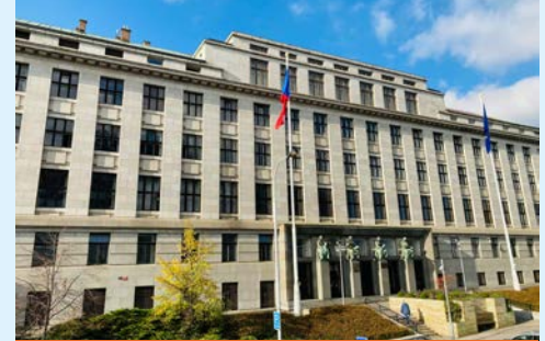
Rilancio provides FM services in four buildings of the Ministry of Agriculture

For Rilancio, the covid measures have essentially been in place constantly ever since the first wave, with few deviations, because the full occupancy of the buildings has not returned to normal for the entire time. It was necessary to react to the decrease in the operations and the occupancy rate of hotels, shopping centres and office buildings. The optimisation of personnel and the economic demands of partially-occupied buildings are still taking place. The set of relevant measures is also changing with