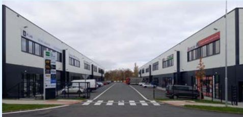
City Park Hostivař, Prague 10 Integrated FM: Rilancio

"Today, when properties are once again coming to life, we have an abundance of experience, inspiration and ideas and we can build on that. We believe in professionalism and material communication, and at the same time we are prepared for the new trends the new era is bringing. I believe that our strong experience has brought us together and we will continue to be support for our existing and new customers in the future. In spite of the continuing attack of the pandemic, we are therefore looking forward to the new year with optimism," concluded Ryvola.