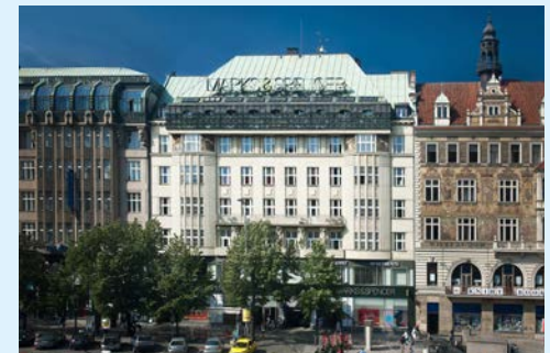
Melantrich, Prague 1 ■ Integrated FM: Rilancio

The first covid wave in March took the company, just like the other service providers, by surprise and it was necessary to set up new standards and adapt the services to the situation that had arisen, which was not easy. Rilancio first had to secure its employees and optimise the operations of the individual buildings, whether they were office buildings, shopping centres, hotels and accommodation facilities or industrial complexes. The employees received the necessary protective equipment, such as masks and hand and surface disinfectants. It was necessary to issue a directive protecting employees. At the same time, it was important, when