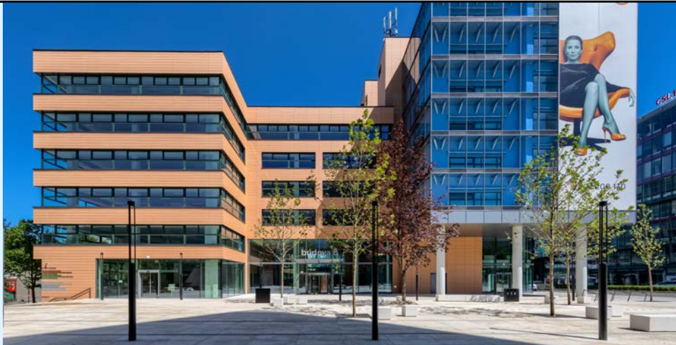
BB Centrum – Budova B, Prague 4 – Michle ■ Technical facility management: Rilancio